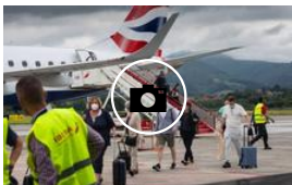
El aeropuerto de Hondarribia estrena su conexión con Londres