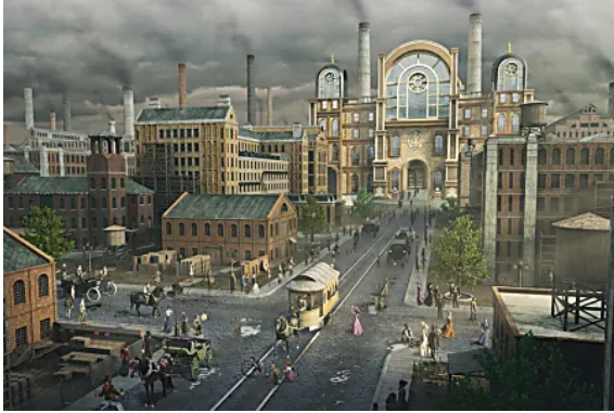
Si necesitas pasar el tiempo, este juego clásico es imprescindible. Juega sin instalar.