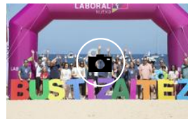
Gipuzkoa se moja por la esclerosis múltiple