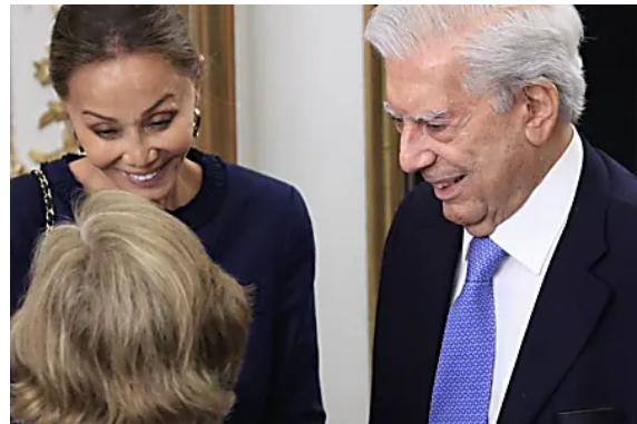
Isabel Preysler, madrina de excepción en la boda de su sobrino