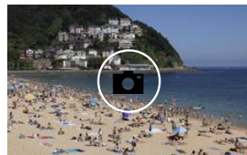
El fin de semana arranca con sol y las calles repletas de gente