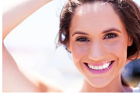
¿Dientes torcidos? DrSmile busca 200 españoles para una consulta gratuita