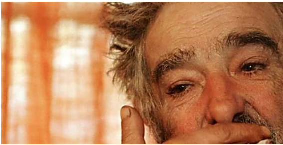
Cuando 'el Pepe' Mujica intercedió por la vida Blanco y la izquierda abertzale le despreció