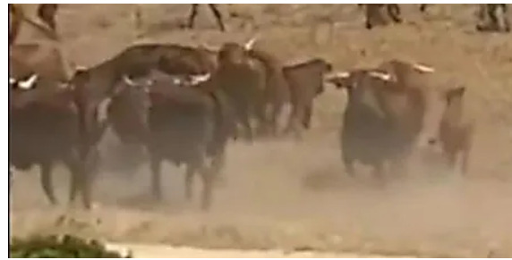
Un grupo de soldados españoles es atacado por un rebaño de vacas