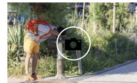
Euskadi se adentra en la segunda ola de calor del verano