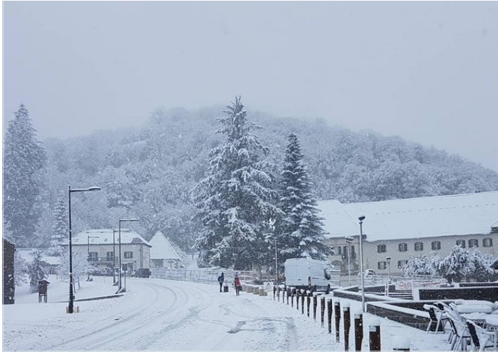
Jon Martínez @Lagranrespuesta

El estado de las carreteras , pese a todo, es de normalidad. Según las previsiones del tiempo, la cota de nieve se ha situado entre los 500 y los 800 metros, aunque puntualmente ha nevado en cotas inferiores, como en Pamplona y Comarca . Ya para esta tarde, está previsto que la cota de nieve suba hasta los 1.000 metros.