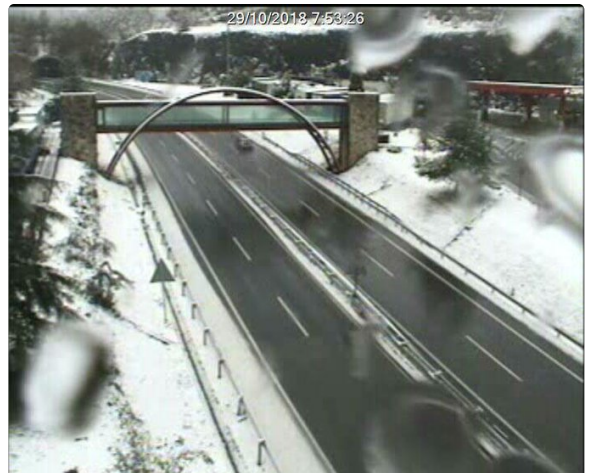
Policía Foral-Foruzaingoa @policiaforal_na

Desde las cuentas en Twitter de Policía Foral y de DYA de Gipuzkoa se pide precaución a los conductores.