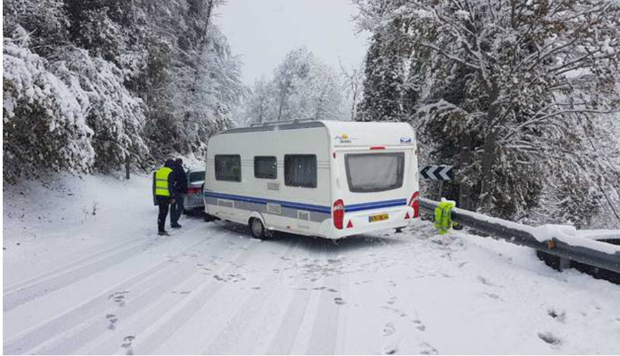
Nieve a finales de octubre en Navarra El descenso de temperaturas propició que las nevadas regresaran este 29 de octubre a varios puntos de Navarra Nieve a finales de octubre en Navarra. Javier Idiazabal Chourraut

Se prevé que para la tarde la cota de nieve suba hasta los 1.000 metros.